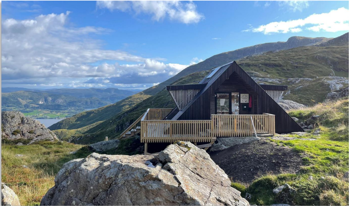
Dagsturhytta i Askvoll ligg ved Nykvsvatnet i Holmedal, 455 meter over havet.

installert vedomn. Askvoll kommune er eigar av hytta, medan Holmedal Vel har ansvar for den daglege drifta.