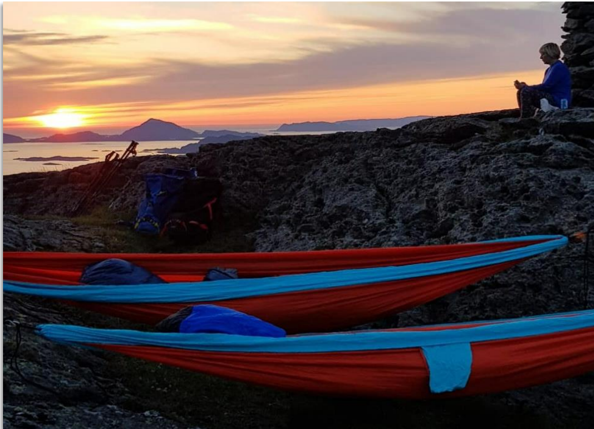
Høgeheia i Stongfjorden.