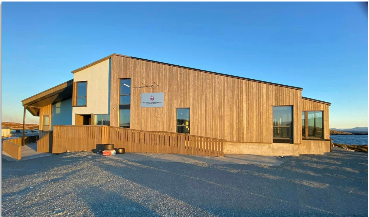
Bulandet og Værlandet fleirbrukshall opnar i 2024.

I desember 2022 vart sanitærbygget og båthus, tilknytt fleirbrukshallen i Bulandet, ferdigstilt. Her er det gode fasilitetar med dusj, vaskemaskin og tørketrommel i sanitærbygget, medan i båthuset er det mykje sjøutstyr som kan lånast til sjøaktivitet.