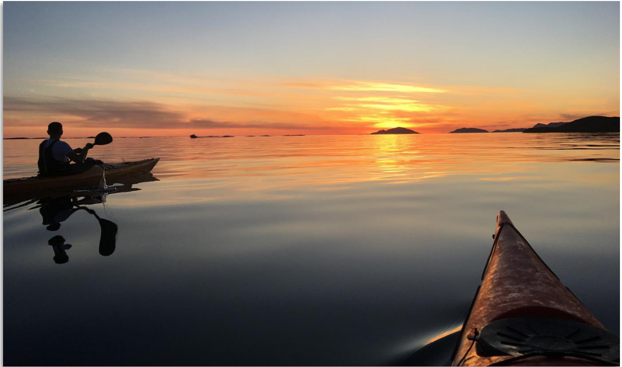
Padletur i Staveneset.