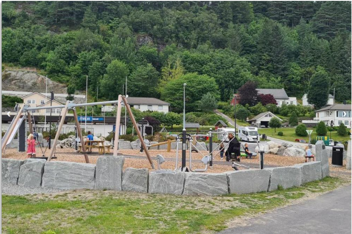
Bøparken i Askvoll sentrum.