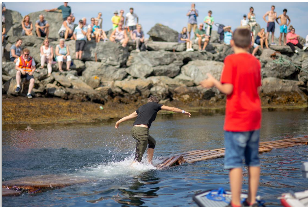
Krabbefestivalen på Atløy har fleire ulike aktivitetar.

Andre festivalar som har vore arrangert i kommune: Holkerock, Nordsjøporthelga, Værlandia, Stongfjordveka (2023), Dalsfjordveka (samarbeid med Fjaler og Sunnfjord), Påske- og julejam.