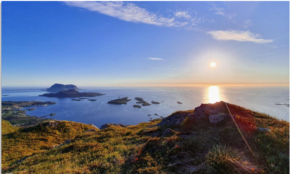
Hovden på Atløy.

Det vert gjort ein stor dugnadsjobb i grendene på merking, vedlikehald og tilrettelegging av turstiar for innbyggjarane.