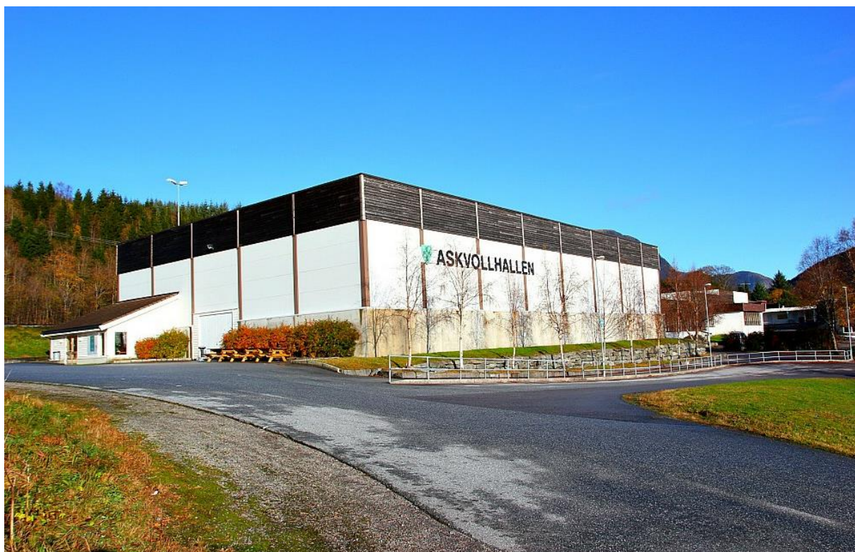
Askvollhallen stod ferdig i 1999 og ligg attmed Askvoll skule, symjehallen og skuleidrettsplassen.

Nærmiljøanlegg er eit utandørs anlegg eller område for eigenorganisert idrett eller annan fysisk aktivitet som ligger i tilknytning til bu- og/eller opphaldsområder. Nærmiljøanlegg kan unntaksvis brukast til organisert fysisk aktivitet og skal ikkje ivareta den organiserte aktivitetens behov på fast basis.