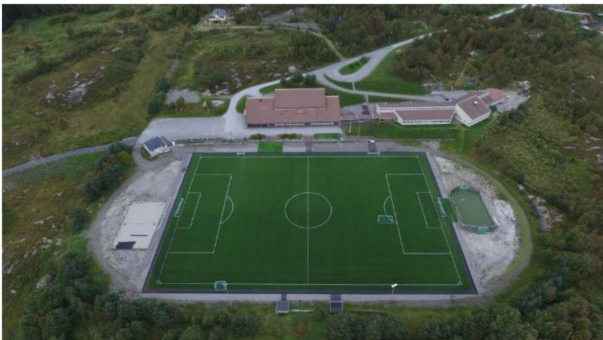
Kunstgrasbana på Atløy stadion.