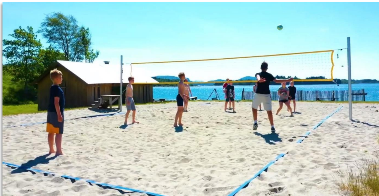
Volleyballbana på Øyra er populær om sommaren.