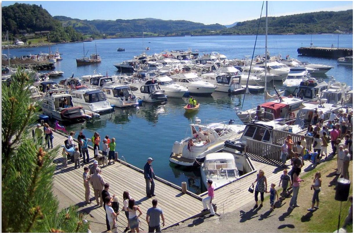
Sentrumshamna i Askvoll.