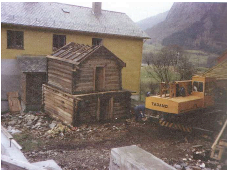
Mellomalderbua på Ringstad