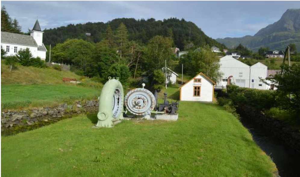
Kulturminne i Stongfjorden. I framgrunnen turbinen frå BACO sitt kraftverk, bak t. h. badehuset "Baden". I bakgrunnen t. v. kapellet og t. h. fabrikk

bilete, vegskilt for kulturminne, avskrift og utgjeving av protokollane til Bernt Askevold og tusenårsjubileet er nokre av sakene som har stått på agendaen. Sogenemnda har fram til 2018 gjeve ut i alt 23 sogehefte, slektssoge i tre bind (1971–87), allmennsoge i to bind (2009–11) og fleire andre bøker og publikasjonar.