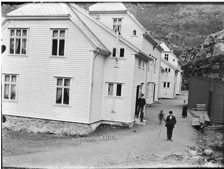
Frå "Gata" i Stongfjorden tidleg på 1900-talet.

Stongfjorden utvikla seg til ei reindyrka industribygd etter at British Aluminium Company (BACO) overtok dei tidlegare fabrikkane i bygda og sette i gang aluminiumsverk. Fabrikken bygde eigne arbeidarbustader oppe på Småbakkane, den såkalla "Gata" og dreiv dessutan skulen i bygda frå 1918. Direktøren og ingeniøren ved verket hadde sine eigne, staselege villaer eit stykke unna og hadde eiga tennisbane. Verket var i drift til 1945. Seinare overtok knivfabrikken i Holmedal anlegget og dreiv ei tid ei avdeling her.