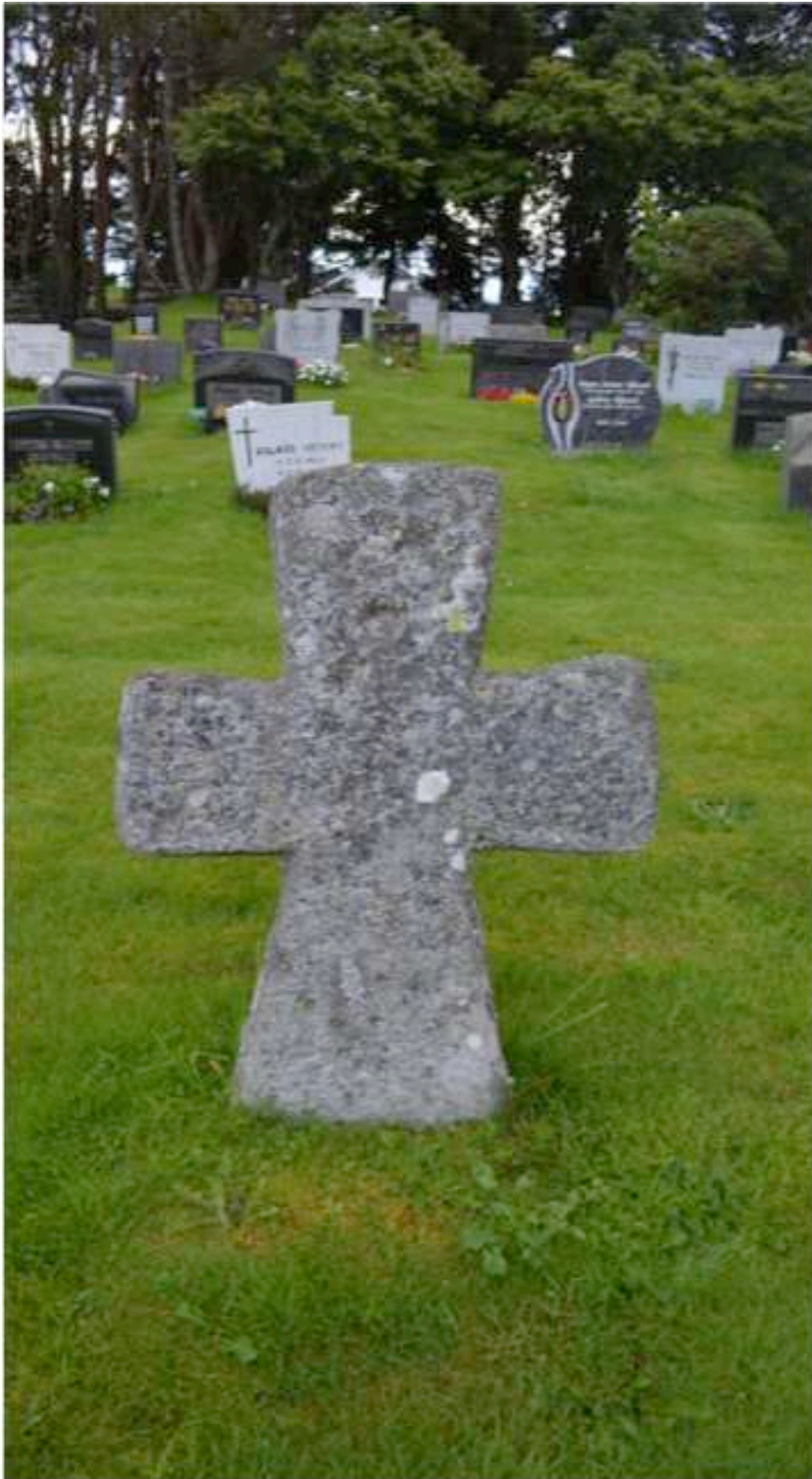
Steinkross på kyrkjegarden på Vilnes