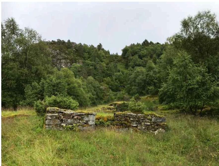
Husmurar i Skorvebotnen

Mange teigar som tidlegare vart hausta eller beita som ein del av kulturlandskapet, ligg i dag brakk eller gror att med kratt og småskog. Somme stader kan vi finne murar etter tidlegare hus og steingardar som ikkje lenger er i bruk. Eit døme på ein fråflytta husmannsplass der det er slutt på innhaustinga finn vi i Skorvebotnen nordaust for Øyravatnet.