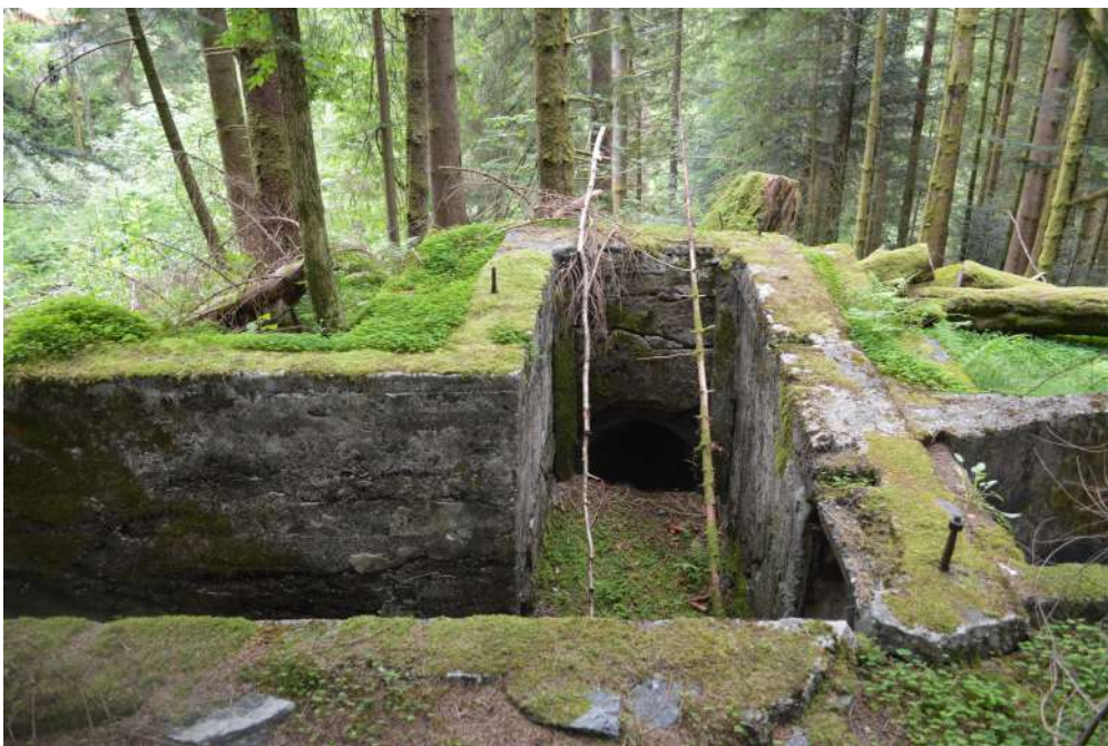
Restar av kraftanlegget ved Trollefossen i Holmedal

I Holmedal er knivprodusenten Helle Fabrikk i full verksemd i fabrikk ved kaien som opphavleg blei sett opp som smørfabrikk i 1900, og som seinare er bygt på fleire gonger. Ved kaien er det innreia pub i det tidlegare bakeriet, og den gamle bakaromnen er nyleg restaurert. Meieribygget frå 1934, der det var drift fram til 1962, er no laga til som bygdemuseum med ei utstilling som i stor grad fokuserer på industrihistoria til bygda. Ved Trollefossen står framleis ein del av fabrikkbygningen, ei pipe og restar av kraftanlegget til Trollefossen Uldvarefabrikk. Området kring Trollefossen er oppført som omsynssone i kommuneplanen sin arealdel.