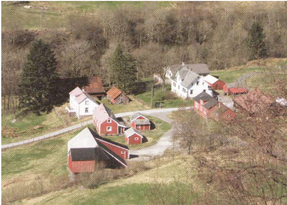
Klyngetun på Bakke i Holmedal

Målet med satsinga på lokale kulturminneplanar er å styrke kommunane si operative rolle på kulturminnefeltet. Satsinga er ei oppfølging av det nasjonale satsingsområdet "Kunnskapsløft for kulturminneforvaltninga 2010–2014".