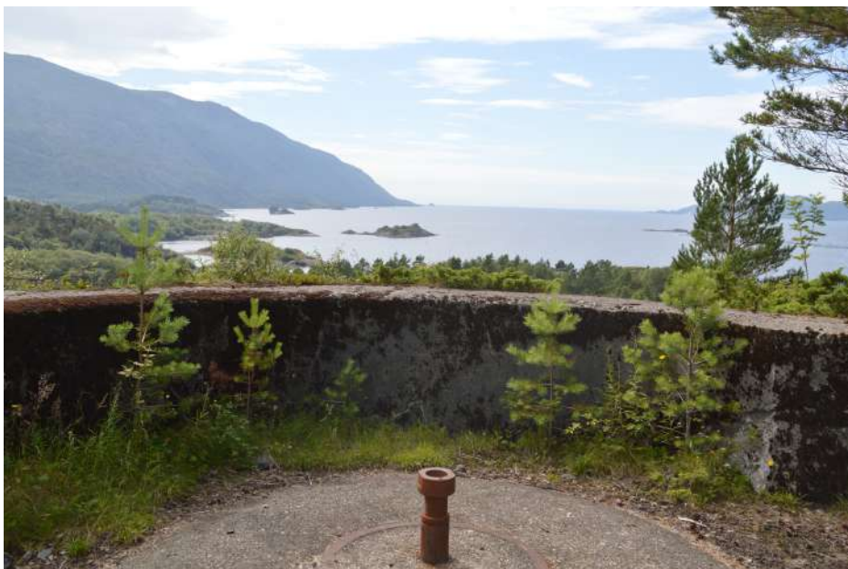
Kanonstilling på Storehaugen i Flokeneset

Ved Herland og på Sandøyyna var det flymeldepostar. På Sandøyyna var det også sett opp radarstasjon. Staveneset og Geita hadde kystvaktpostar. Dei største anlegga fanst ved Eidmind og Storehaugen i Flokeneset, der det blei bygt opp kystfort med bunkersar og kanonstillingar. Det vart også sett opp brakker og bygt vegar i tilknytning til anlegga. Askvoll sentrum var støttepunkt med hamnekaptein, signalstasjon og eit mindre kystartillerianlegg.