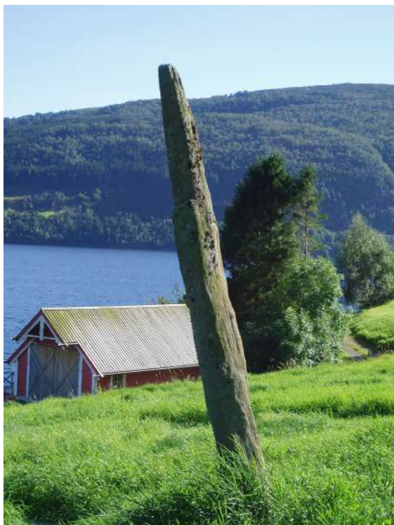
Bautastein i Rivedal

Ein annan type gravmarkeringar er bautasteinar, som førekjem som gravminne gjennom heile jernalderen fram til kristen tid. Frå folkevandringstida og vikingtida finst det dessutan bautasteinar som ikkje markerer graver, men som er sette opp som minnesteinar. I Askvoll finst det sju registrerte bautasteinar frå førhistorisk tid – på Alden, Vilnes, i Holmedal og Rivedal. Fleire av dei er reiste att i nyare tid, så det er uråd å seie sikkert kvar dei har stått tidlegare. I lokal tradisjon har det blitt hevda at bautasteinen i Rivedal er sett opp til minne om Ingolf Arnarson, mens bautasteinen i Kleppeneset er til minne om fosterbror hans, Leiv. Men det er liten grunn til å tru at munnlege tradisjonar i Askvoll-området går heilt tilbake til 800-talet. Dei tre steinane på Vilnes kyrkjegard kan ha markert eit mogleg gravfelt ved tunområdet.