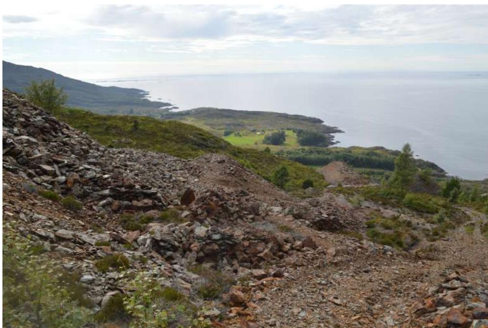
Slagghaug ved gruvene i Grimelia

Det finst også to andre lokalitetar i Askvoll der det har vore gruvedrift i mindre omfang. På Haugsneset ved Gjervika tok dei ut svovelkis i 1860-åra og i Vågeskaret blei det drive prøvedrift med utvinning av kopar i midten av 1870-åra. Begge stader er det synlege spor i terrenget etter drifta.