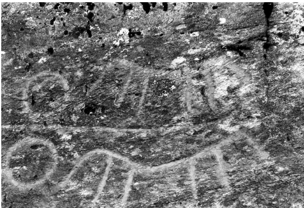
Vognfiguren på Staveneset

Dei fleste figurane både på Atløyna og Staveneset har båtar som motiv. Den nest største gruppa av ristningar er groper, som er skålforma fordjupingar hogde inn i fjellet. Den mest spesielle figuren som er funnen er ei tohjula vogn med kusk og to hestar spent føre. Vognfiguren på Staveneset er eit særstykke i Norge og næraste parallell finst i Skåne. Bergkunsten i Askvoll er vanskeleg å datere, men er tolka til å vere laga hovudsakleg midt i bronsealderen.