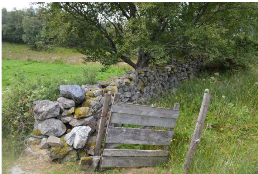
Gammal steingard på Eidmind

Lovdata ( https://lovdata.no/dokument/NL/lov/1978-06-09-50 )