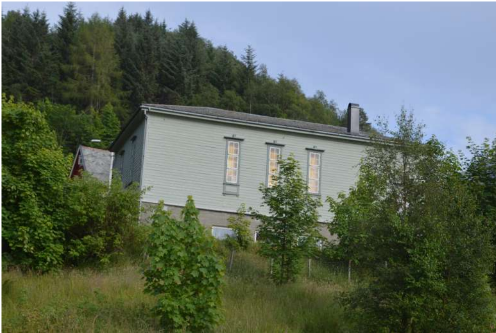
Losjehuset i Stongfjorden

Skulehusa vart nytta til forsamlingslokale for ulike tilstellingar – møte, festar og basarar. Men etter kvart kom det eigne samfunnshus i dei ulike bygdene. Dei eldste noverande bygdehusa er husa i Holmedal (1960), Askvoll (1968) og Bulandet (Fiskarheimen, teken i bruk 1971). Det mest moderne samfunnshuset har Atløy, det opna i 1993 og har seinare blitt samlokalisert med skule og barnehage. I Stongfjorden står eit litt meir særprega forsamlingshus – losjehuset Skålefjelltun. Huset vart bygt i 1936 og hørte til fråhaldslosjen i bygda. Det er no selt til private og vert nytta som galleri og kafé.