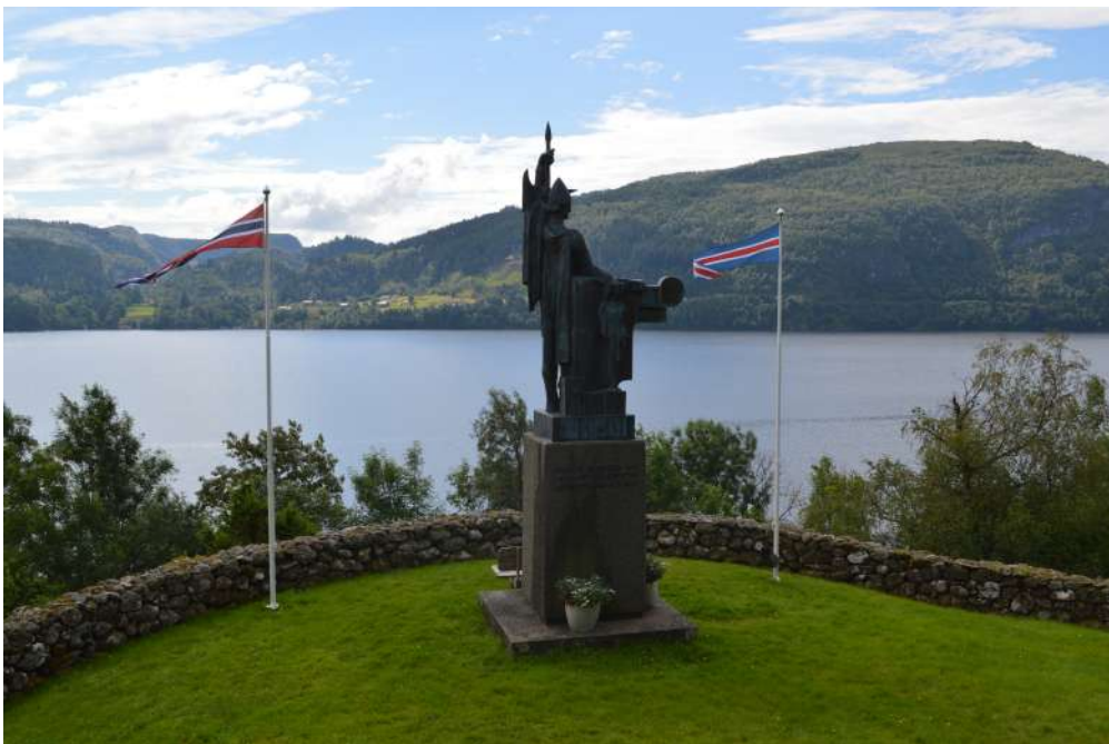
Ingolf Arnarson-statuen i Rivedal

I vikingtida tok folk frå distriktet til å fare over havet for å busetje seg på Vesterhavssøyane. I følge to versjonar av den islandske Landnåmabok kom den første landnåmsmannen på Island, Ingolf Arnarson, frå Dalsfjorden. I Askvoll finst det fleire bautasteinar frå denne perioden. Samstundes vitnar steinkrossar om tidleg kristen påverknad vestfrå. Utover i mellomalderen vart kyrkja ei viktig samfunnsmakt, og skriftlege kjelder peikar på Askvoll, Holmedal og Vilnes som eldgamle kyrkjestader.