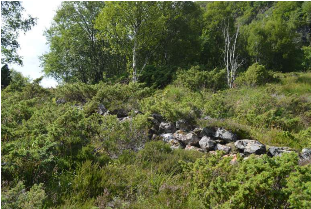
Den gamle ridevegen over Osland frå Stongfjorden til Vågane

Den eldste offentlege landevegen i Askvoll var ridevegen frå Vågane over Osland til Stongfjorden, som vart bygt på slutten av 1700-talet. I 1862 vart han nedlagt som offentlig veg. Murane i ein eldre veg på denne strekninga er framleis råd å finne ved Håkleiva nord for Stongsvatnet.