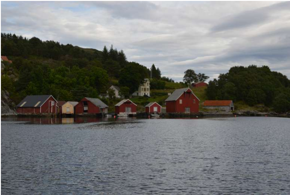
Naustmiljø i Nærvika ved Vilnes

Staten har eigedomsretten til lause kulturminne (våpen, reiskapar, bygningsrestar, skjelett, arkiv m. m.) eldre enn 1537 som kjem for dagen tilfeldig, ved funn, utgravingar eller på annan måte. Denne eigedomsretten gjeld også myntar frå før 1650, samiske kulturminne frå før 1917 og gamle båtar, skipsskrog o. l. som er meir enn 100 år gamle. Funn av lause kulturminne skal snarast mogleg meldast inn til ansvarleg styresmakt.