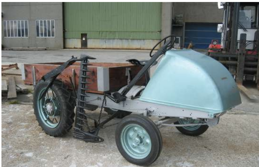
Traktor av typen "Vestland", produsert av Brødrene Klausen tidleg på 1950-talet.

"Askvoll kommune. Plan for vern av kulturminne" frå 1994 (s. 31–36) reknar opp fleire objekt knytte til landbruket som er frå nyare tid (etter reformasjonen) og som kjem inn under verneklasse A, altså fredningsverdig etter kulturminnelova. Desse er 1) gardsanlegg Fjeldet, 2) gardsanlegg Tveit, 3) stølsanlegg Tveit-Hålandsstølen, 4) bualoft Indre Håland og 5) husmannsplass Sellevold. Objektene er omfatta av omsynssoner i kommuneplanen sin arealdel.