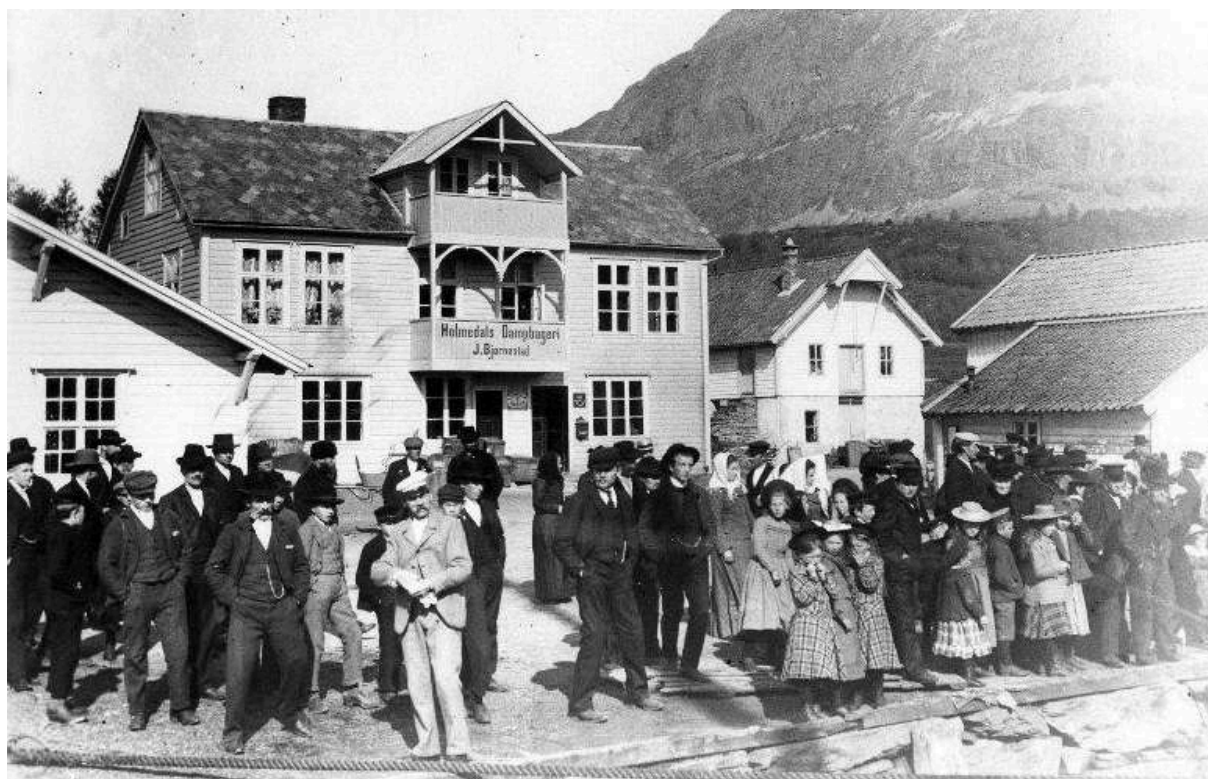
Dampen kjem til kai i Holmedal i 1906

Arbeid med kulturminne er krevjande, både i tid og pengar. Mange faste kulturminne er dyre å restaurere og halde ved like, ikkje minst bygningar. Også lause kulturminne krev ressursar når det gjeld oppbevaring, vedlikehald og formidling.