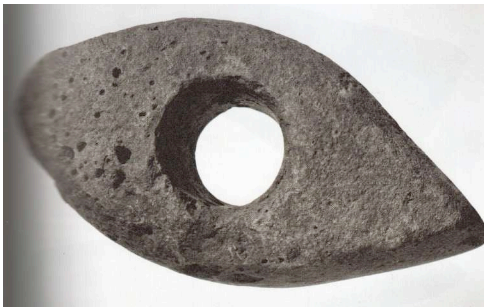
Skafttholøks frå Gjervika

I Askvoll er det funne i alt sju buplassar og aktivitetssområde frå steinalderen. Ein lokalitet er tidfest til eldre steinalder og to til yngre steinalder. Ein av dei sistnemnde ligg i Bakkeneset i Holmedal og er tidfest meir nøyaktig til perioden 4940–4730 f. Kr. Andre stader er det gjort lausfunn, til dømes i Værlandet og Gjervika, av steinøksar frå perioden.