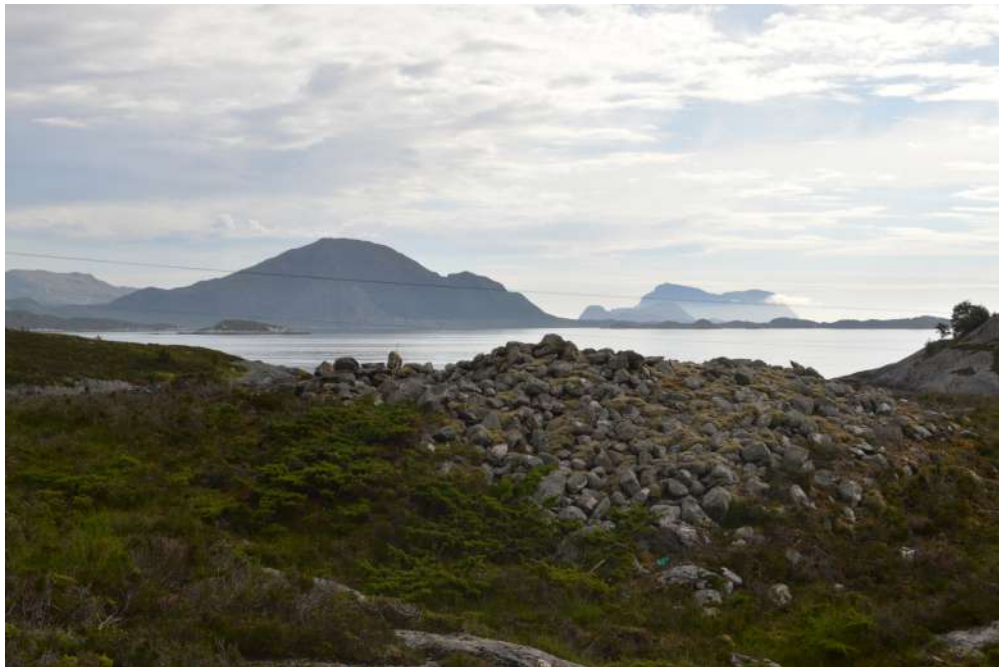
Gravrøys på Staveneset

Omkring 1500 f. Kr. tok ein til å byggje store gravhaugar og –røyser over dei døde langs Norskekysten. Ved inngangen til jernalderen (omkring 500 f. Kr.) vart gravminna meir beskjedne. Seinare tok skikken med å byggje rike gravminne seg opp att, og frå byrjinga av vår tidsrekning blei det stadig vanlegare å leggje ting som våpen, arbeidsreiskapar og ulike verdfulle gjenstandar i gravene.