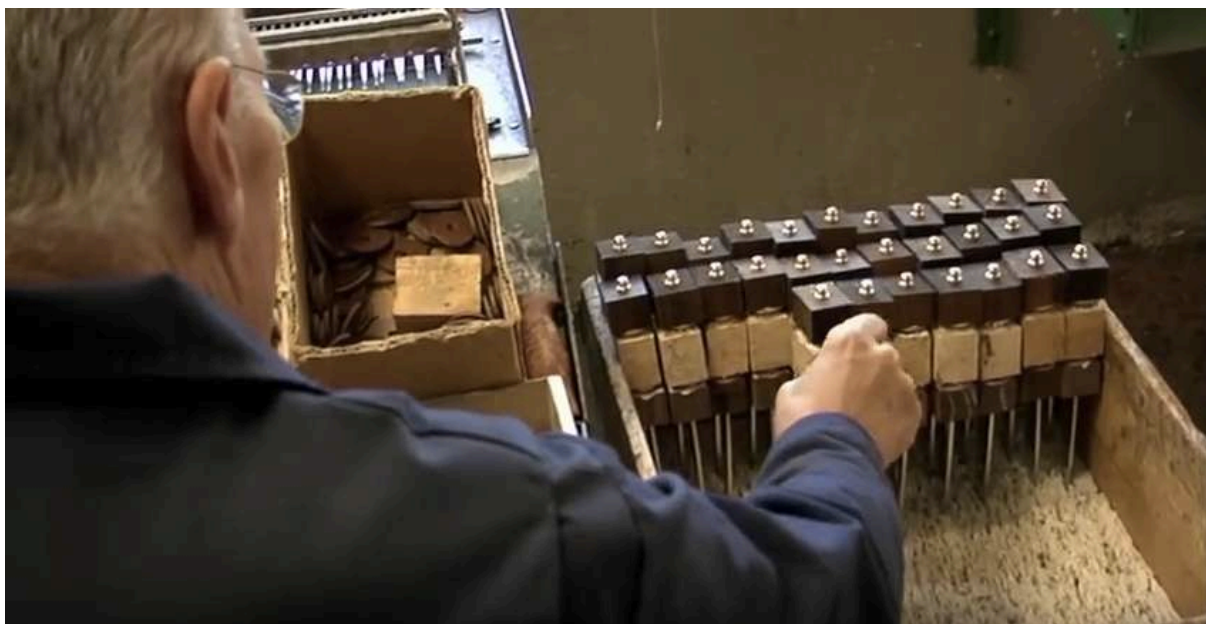
Ved Helle Fabrikker i Holmedal vert knivhandverket halde i hevd