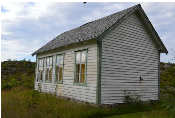
Skulehuset i Holeyvika

Dei fleste av skulehusa i Askvoll er trebygningar, men i teglverksbygda Vårdal er skulen frå 1950 bygt i mur. Skulen her var i drift til 1994.