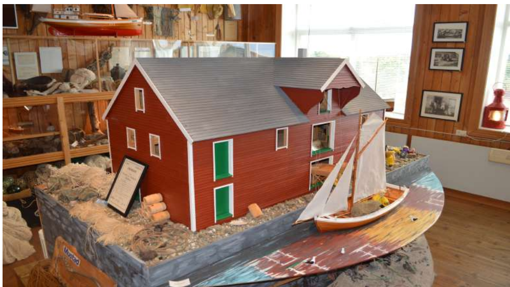
Modell av sjøbu i Temaparken i Bulandet

Ein viktig bidragsytar til kulturminnearbeidet i Askvoll har vore den kommunale sogenemnda, som vart oppretta i 1947 for få gjeve ut ei bygdebok for Askvoll. I 1970-åra vart Askvoll sogenemnd sitt arbeidsfelt utvida, og innsamling av stadnamn og gamle