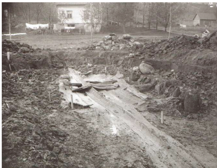
Båtfunn frå folkevandringstida i Holmedal

Berre eit fåtal av gravminna i Askvoll er blitt opna og undersøkte under leing av arkeolog. Dei fleste gravene manglar såleis eksakt datering. Dei fleste vi kan knyte funn til, er frå jernalderen, berre ei røys med funn kan daterast til bronsealderen. I Holmedal vart ei røys opna i 1926 og der viste det seg å liggje restar av ein båt med hud og kjøll av eik på minst 33 fot. Funnet er seinare datert til siste delen av folkevandringstida (490–660 e. Kr). Båten er den eldste kjende i Norge utstyrt med jernnaglar.