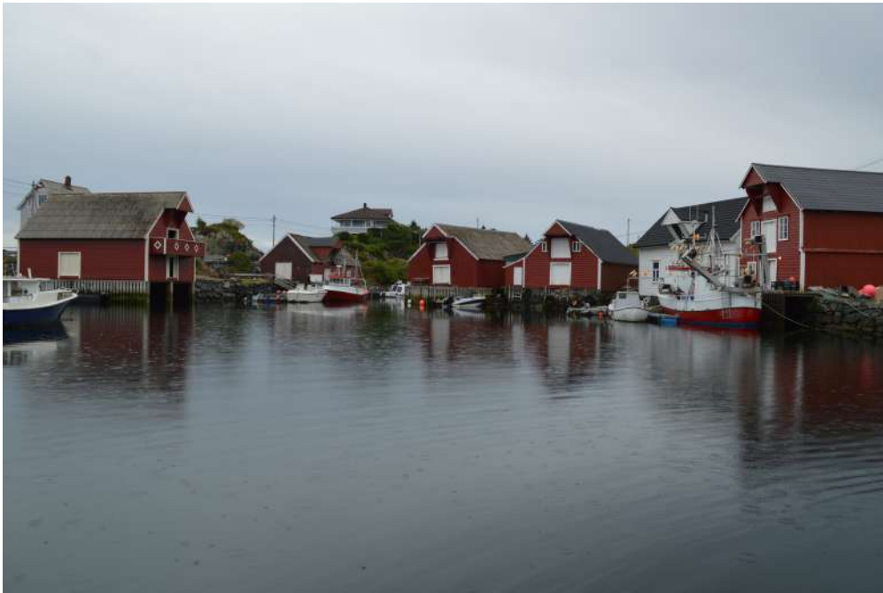
Sjøhusmiljøet i Hamna på Værlandet

Busetnaden i Bulandet er spreidd på mange øyar som ligg langs tronge sund og vågar. Her finst ei rekkje sjøhus, rorbuer og naust som er i bruk, nokre av dei vert leigde ut til turistar. Dei fleste er moderniserte eller ombygde. I det gamle skulehuset i Bulandet er det laga til eit bygdemuseum, Temaparken, som har både ei permanent utstilling og ei som skiftar tema. Fiskeri er eit av fleire tema i den permanente utstillinga.