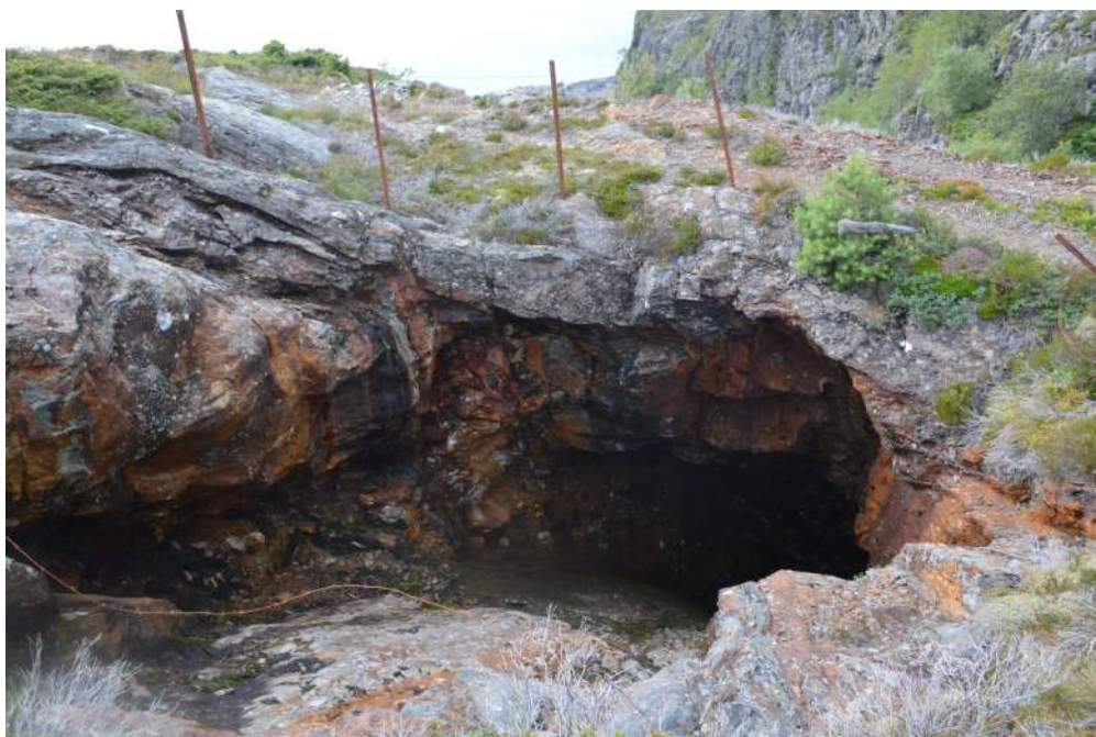
Gruveinngang i Grimelia

Inngrep i automatisk freda kulturminne må berre utførast etter løyve frå ansvarleg styresmakt. Det er høve til å nytte marka over eit automatisk freda kulturminne som beite eller innmark, dersom dette har skjedd tidlegare, men ein må ikkje utføre pløying eller anna jordarbeid djupare enn tidlegare utan særskilt løyve. Utgifter til gransking av automatisk freda kulturminne fell på tiltakshavaren, men ved mindre private tiltak skal staten dekke utgiftene dersom desse blir urimeleg tyngande for tiltakshavaren.