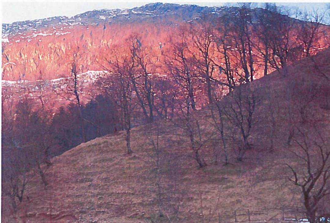
Fjaler: Kulturbeite med Heileberget i bakgrunnen.