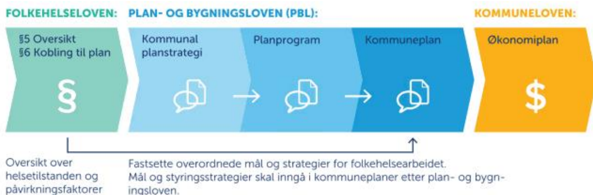
Figur 3. Koplinga mellom folkehelselova (oversiktarbeidet som inngår i kunnskapsgrunnlaget) og kommunal planstrategi.

Figuren under syner koplinga mellom kunnskapsgrunnlaget og kommunal planlegging etter plan- og bygningslova og kommunelova, samt kommunal planstrategi i det kommunale plansystemet.