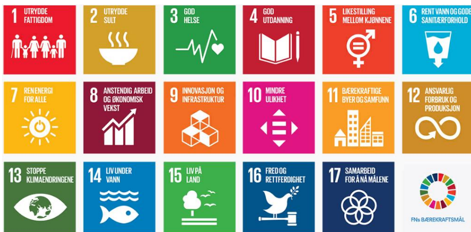
Figur 1: FN sine 17 berekraftsmål.

Regjeringa ber lokale og regionale myndigheiter forstå og tolke dei nasjonale forventningane i ein lokal samanheng når ein utarbeider og gjennomfører planar. Det vil vere svært krevjande å satse på alle berekraftmåla i ein kommuneplan, og ein del av planarbeidet vert å jobbe med korleis vi skal jobbe med berekraftmåla i Askvoll kommune.